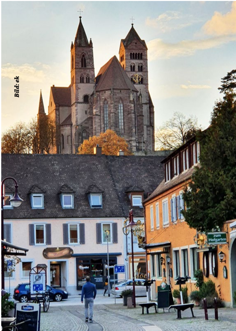
Breisach auf dem Weg zur Klimaneutralität

Mit dem Instrument der kommunalen Wärmeplanung können Städte und Gemeinden Strategien zum langfristigen Umbau der Wärmeversorgung entwickeln. Das Ziel ist hierbei, im Jahr 2040 die Klimaneutralität im Wärmesektor zu erreichen. Dafür bietet der kommunale Wärmeplan eine strategische, umsetzungsorientierte Handlungsgrundlage. Mit der Novelle des Klimaschutzgesetzes Baden-Württemberg zum 12. Oktober 2021 gilt für das Zieljahr 2040 die klimaneutrale Wärmeversorgung. Gleichzeitig besteht im Bereich der Wärmewende großer Handlungsbedarf. Zur Zielerreichung muss der Wärmebedarf reduziert werden und der verbleibende Bedarf an Wärme auf klimaneutrale Weise gedeckt werden. Die kommunale Wärmeplanung wurde als Instrument eingeführt, um die Kommunen bei der Umsetzung der Ziele zu unterstützen. Gemeinden mit über 20.000 Einwohnern sind zur Wärmeplanung verpflichtet. Alle restlichen Gemeinden können freiwillig eine Wärmeplanung durchführen und profitieren derzeit noch von einer Förderung in Höhe von 80% der zuwendungsfähigen Ausgaben. Dabei haben Kommunen die Möglichkeit, die Wärmeplanung gemeinsam in Konvois mit benachbarten Gemeinden durchzuführen. Die Gemeinden Breisach, Ihringen, Vogtsburg und Merdingen streben eine gemeinsame Wärmeplaner-