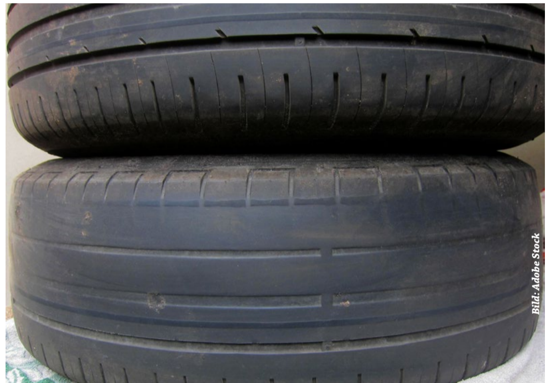
Diese Reifen sind mit Sicherheit nicht wintertauglich

Welches Bußgeld droht ohne Winterreifen? Der Verstoß wird für den Fahrer mit einem Bußgeld in Höhe von 60 Euro geahndet, werden andere behindert kostet es schon 80 Euro. Außerdem gibt es einen Punkt in Flensburg. Dem Halter drohen ebenfalls 75 Euro und ein