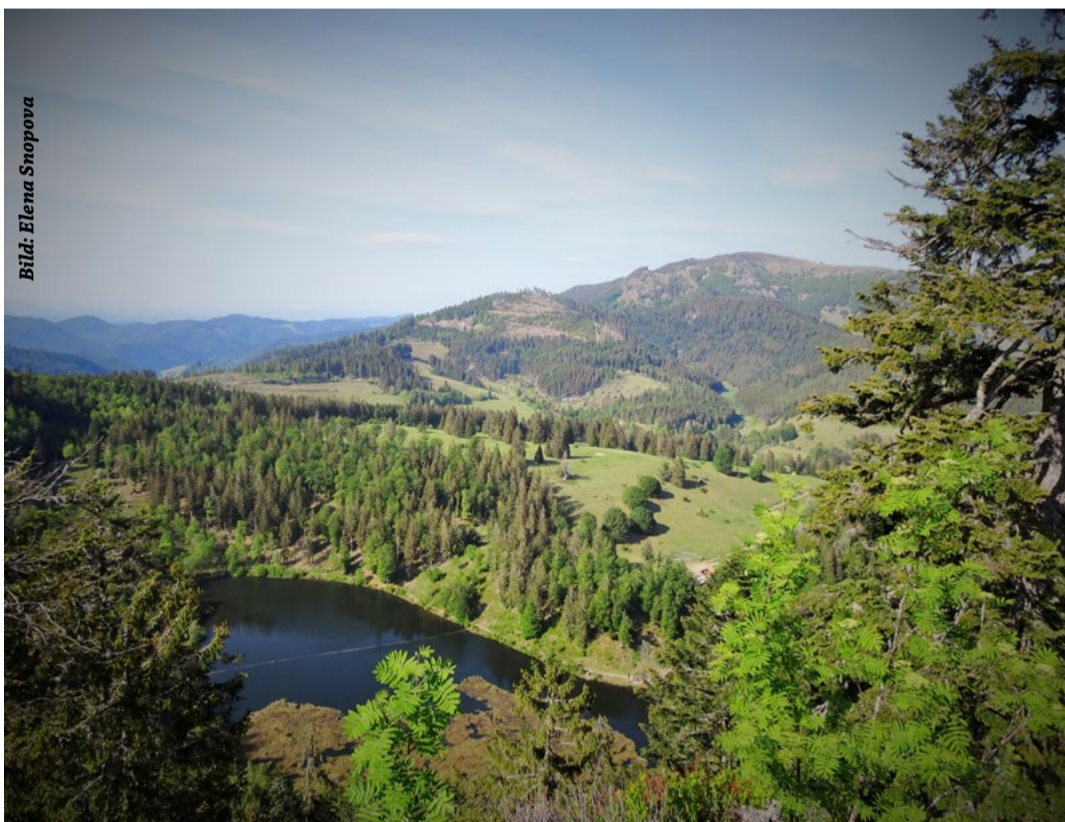
Vierthöchster Berg des Schwarzwaldes, der 1414 Meter hohe Belchen mit Karsee Nonnenmattweiher im Vordergrund

Mächtige Eismassen bedeckten weite Teile des Schwarzwalds