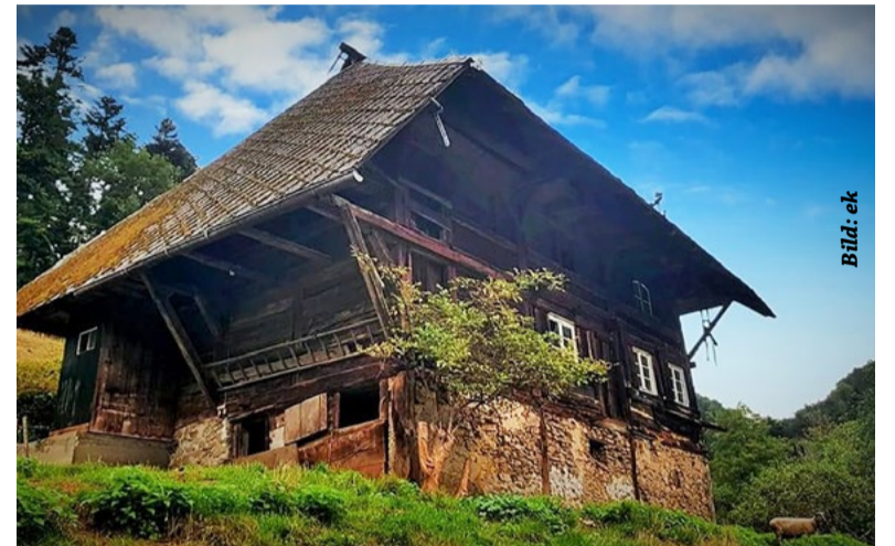
In Stegen-Eschbach steht ein Schwarzwaldhof, das Hinterburehisli

Zuletzt wurde das Berghäusle von 1978 bis 2016 von einem Mann bewohnt, der mit Freunden dort lebte. Neben seinem