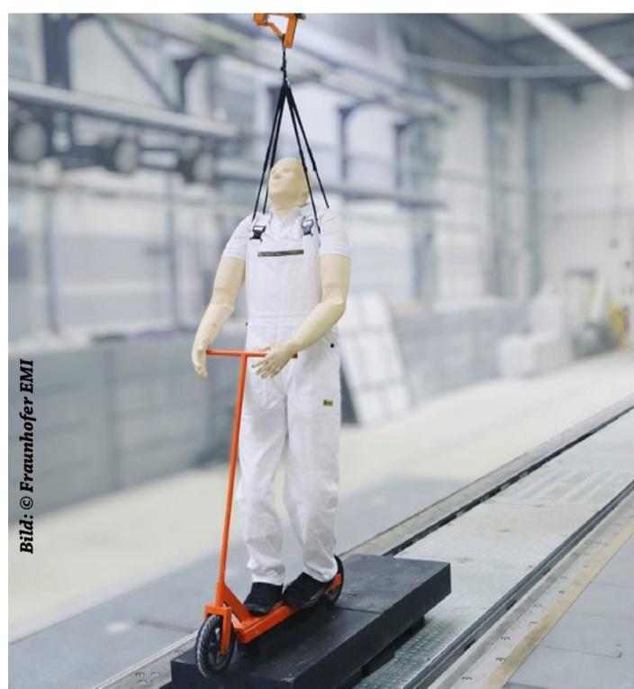
Beim Crashtest werden E-Scooter und Dummy mit 10, 20 und 30 km/h gegen eine Kante gesteuert. Bereits bei 10 km/h ist das Verletzungsrisiko erheblich.

Sie sind praktisch, enorm flexibel und versprechen umweltfreundliche Mobilität. Immer mehr Menschen nutzen einen E-Scooter im Stadtverkehr. Dabei häufen sich auch die Unfälle mit schweren Verletzungen. Das Risiko, das mit den schnellen Flitzern verbunden ist, wird vielfach unterschätzt. Nun haben Fraunhofer-Forschende im Projekt »HUMAD« ein typisches Unfallszenario und die damit einhergehenden Verletzungen untersucht. Dabei haben die Expertinnen und Experten auch neuartige Werkstoffe für Helme und Protektoren getestet. Diese könnten viel besser als herkömmliche Produkte schützen. Die Zukunft der Mobilität kündigt sich schon heute an. Eine ganze Reihe neuer Fahrzeugtypen wie E-Bikes, Lastenfahräder, Elektroroller oder E-Scooter flitzen durch unsere Großstädte. Damit eröffnen sich neue Chancen für die flexible und gleichzeitige umweltfreundliche Mobilität – aber auch neue Gefahren und Unfallrisiken. Deutlich sichtbar werden diese Gefahren an den E-Scootern oder „Elektrokleinstfahrzeugen“, so die offizielle Bezeichnung. Zahlen des Statistischen Bundesamts belegen das eindrücklich. So gab es 2020 in Deutschland insgesamt 2155 Unfälle mit E-Scootern. Fünf Menschen kamen dabei ums Leben, 386 wurden schwer verletzt. Bei 75 Prozent dieser Unfälle galten der E-Scooter-Fahrer oder die Fahrerin als Hauptverantwortliche. Besonders häufig waren Unfälle, bei denen die Fahrer die Kontrolle über ihr