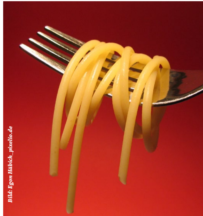
Pasta passen immer - das weiß man nicht nur in Italien, sondern auch bei uns im Südwesten

nun mehr „al dente“ zubereitet wurden. Je kürzer die Kochzeit von Pasta, desto weniger Stärke kann der Körper daraus verwenden, desto kalorienärmer ist die Nudel. Vollkorn-Spaghetti sind