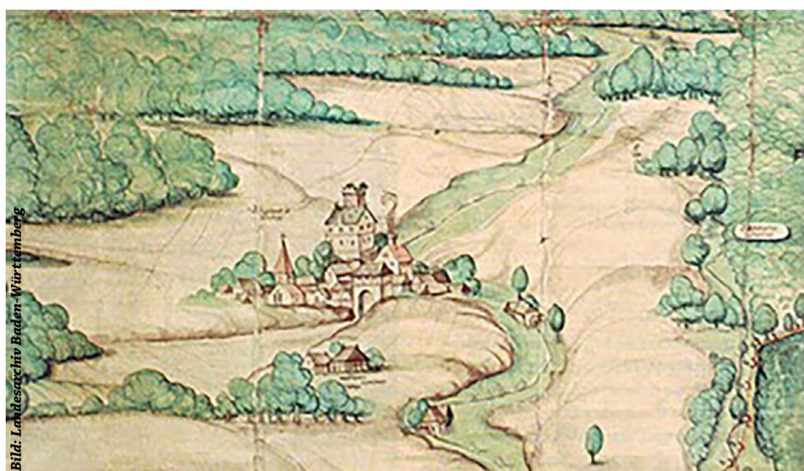
Strittige Wälder zwischen Herrschaft und Gemeinde, kolorierte Jagdgrenzkarte, Ausschnitt, 1593

Indes kann der Hornberger Anspruch auf Mitnutzung so unbegründet nicht gewesen sein, wurde doch 1540 Götz von Berlichingen als dem Herrn der Burg in einem Urteil des Pfälzer Kurfürsten das Recht zugesprochen, aus der Michelherd jährlich kostenlos 400 Reifstangen für den eigenen Bedarf zu beziehen, mit der vielsagenden Einschränkung „so lang und vil es der Waldt erleiden moge“. Rund ein halbes Jahrhundert spä-