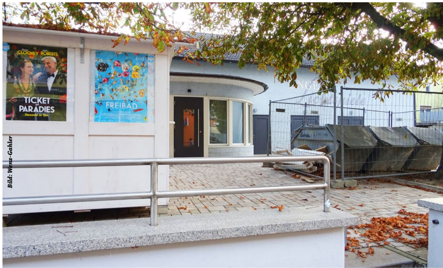
Der alte Breisacher Filmpalast wird bald in neuem Glanz erstrahlen

Ein großzügiges Foyer wird bald die Besucher erfreuen