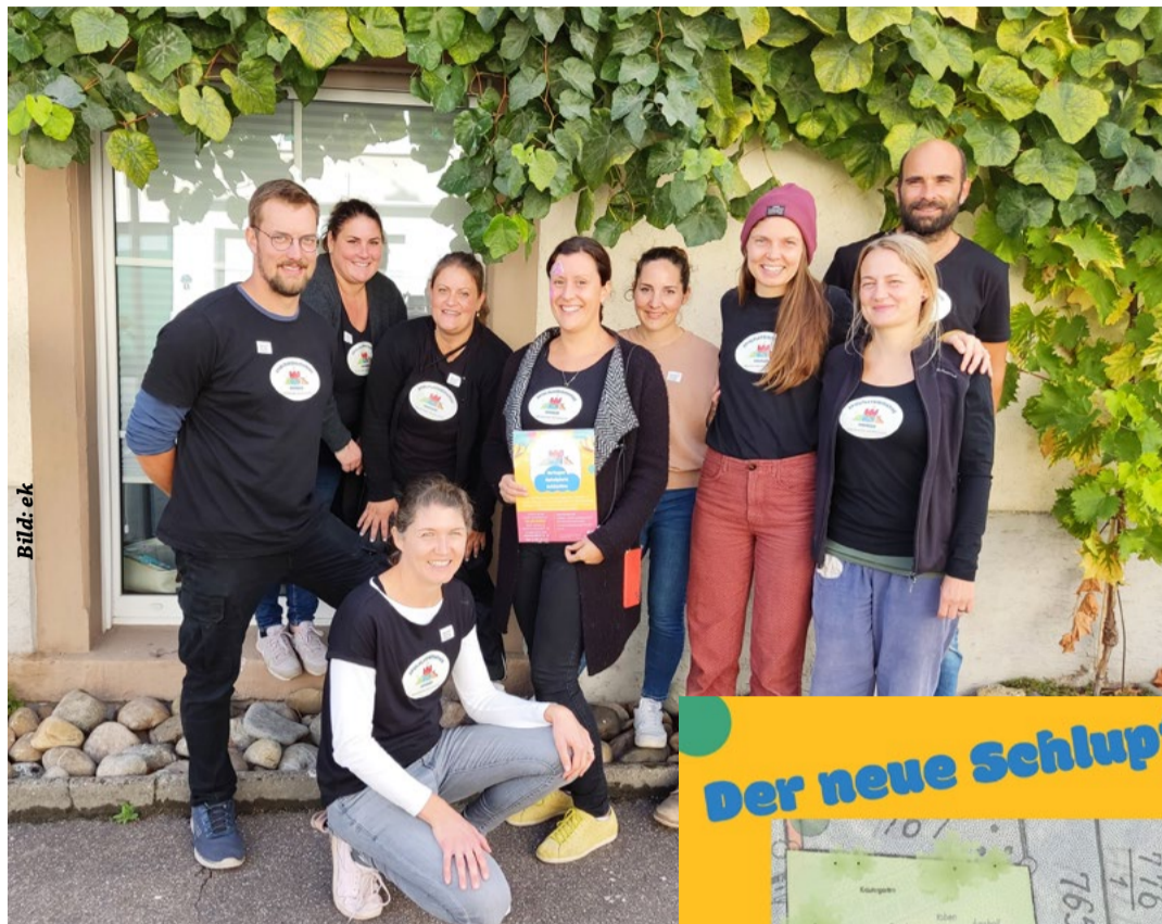
Die Eltern setzen auf viel Eigeninitiative

Eine Ihringer Elterninitiative will das Projekt weiter bringen