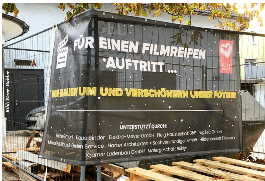
Unternehmen aus der Region unterstützen den Neuauftritt des Kommunalen Kinos Breisach

Die gesamte Umbaumaßnahme wird voraussichtlich bis Mitte Dezember dauern, sodass zu Weihnachten das Kino bereits über ein neues Foyer erschlossen werden kann. Während der Bauphase wird der Zugang zum Kinosaal überwiegend durch das Foyer erfolgen; zum einen aus energetischen Gründen, zum anderen, um die Kinobesucher am Umbauprozess teil-