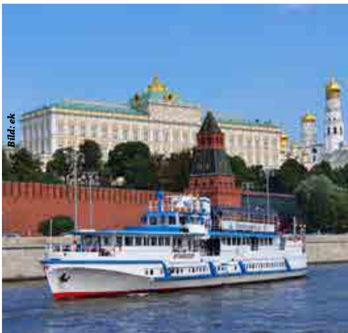
Schiffahrt auf der Moskwa mit Blick auf den Kreml

Differenzen sind sie sich einig, so etwas wie Moskau existiert kein zweites Mal und weite Stadtteile sind UNESCO Weltkulturerbe. Es ist die Historie, die in dieser Stadt praktisch in der Luft liegt. Ihre Geschichte ist wie ihre Seitengassen, durcheinander, manchmal schmutzig, und doch male- risch. Nur eines ist sie nicht, langweilig. Denn Moskauer Geschichte ist russische Geschichte. Woher der Name „Moskau“ kommt, versuchen gleich mehrere Ethymologen zu klären. „Moskau“ sei von slawischen Worten wie „Vollkornbrot“ und „Pfütze“ abgeleitet. Von beidem gibt es in der russischen Hauptstadt reichlich. Erstmals taucht Moskau 1147 urkundlich auf, dieses Jahr gilt als das Gründungsjahr Moskaus. Moskaus erste Befestigungsmauer wurde aus Holz hochgezogen. 200 Jahre später erhielt die hölzerne Burgmauer den Namen „Kreml“, was deutsch so viel wie „Burg“ bedeutet. 1382 stürmten mongolische Truppen Moskau und brannten es mitsamt Kreml nieder. Ende des 14. Jahrhunderts entstand in Moskau eine neue