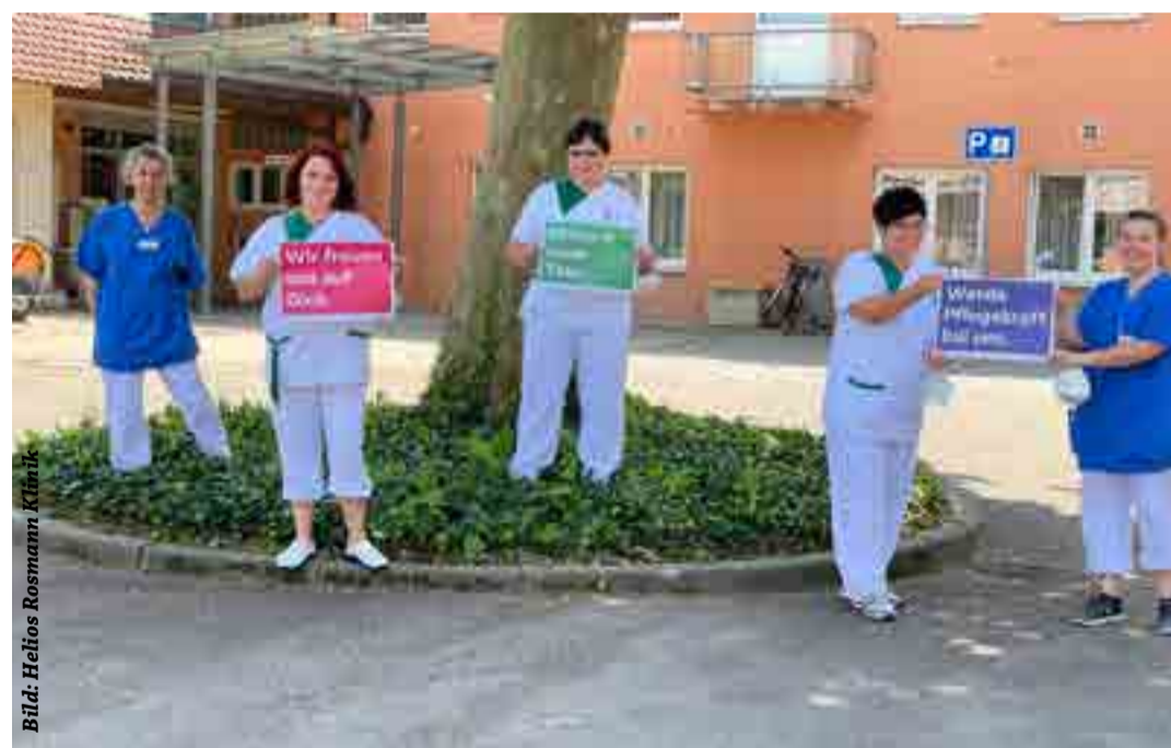
Helios-Kliniken setzen sich für die Pflege als attraktives Berufsbild ein

Gute Argumente, in den Helios Kliniken im Landkreis zu arbeiten, gibt es viele: Eine sinnstiftende Arbeit in familiärer Atmosphäre. Kurze Wege, abteilungsübergreifende Zusammenarbeit.