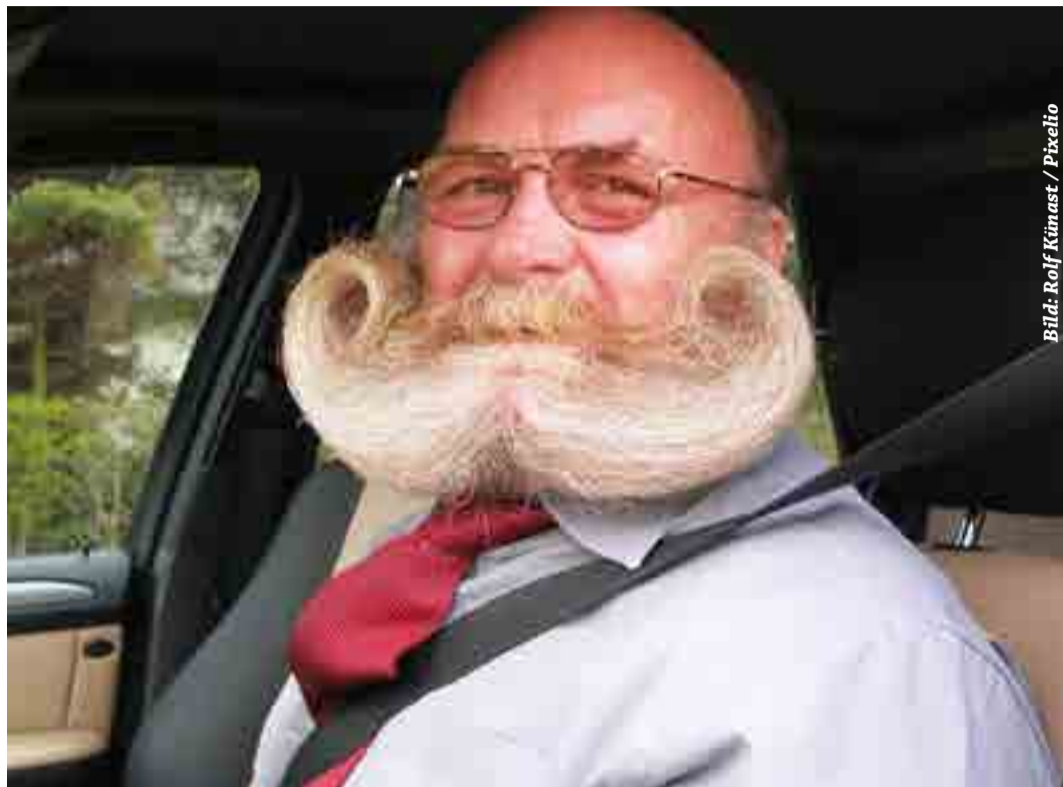
Wie lange benötigt der Mann wohl zur ausreichenden Bartpflege?

Gesichtsbehaarung gilt als besonderer Ausdruck der Persönlichkeit