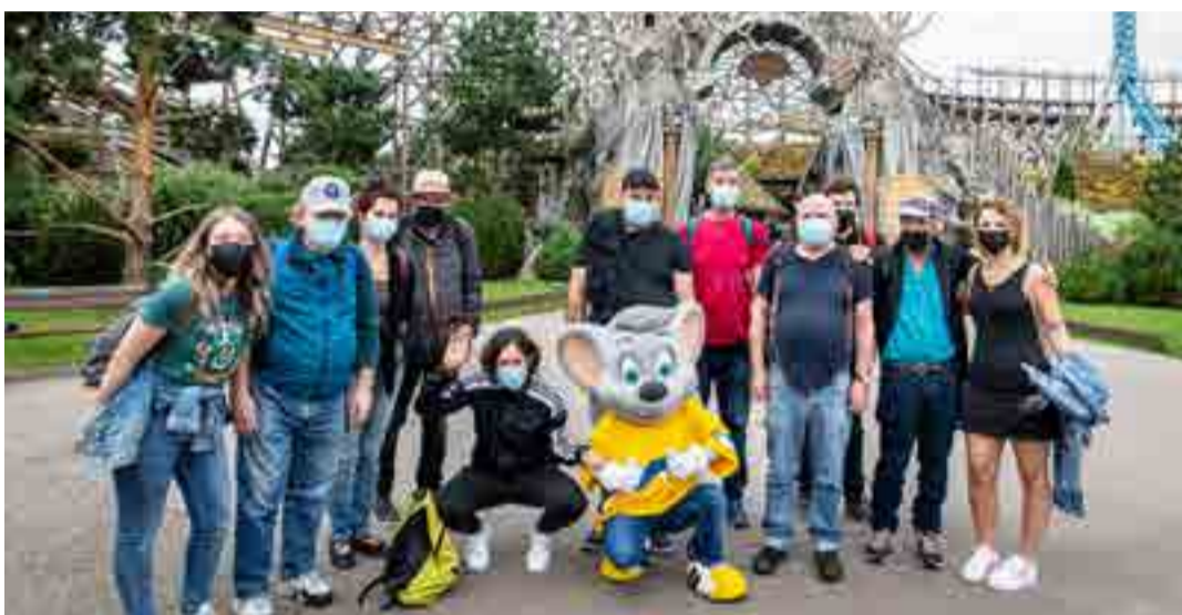
„L'association Santé Mentale Alsace“ aus Wittenheim in Frankreich