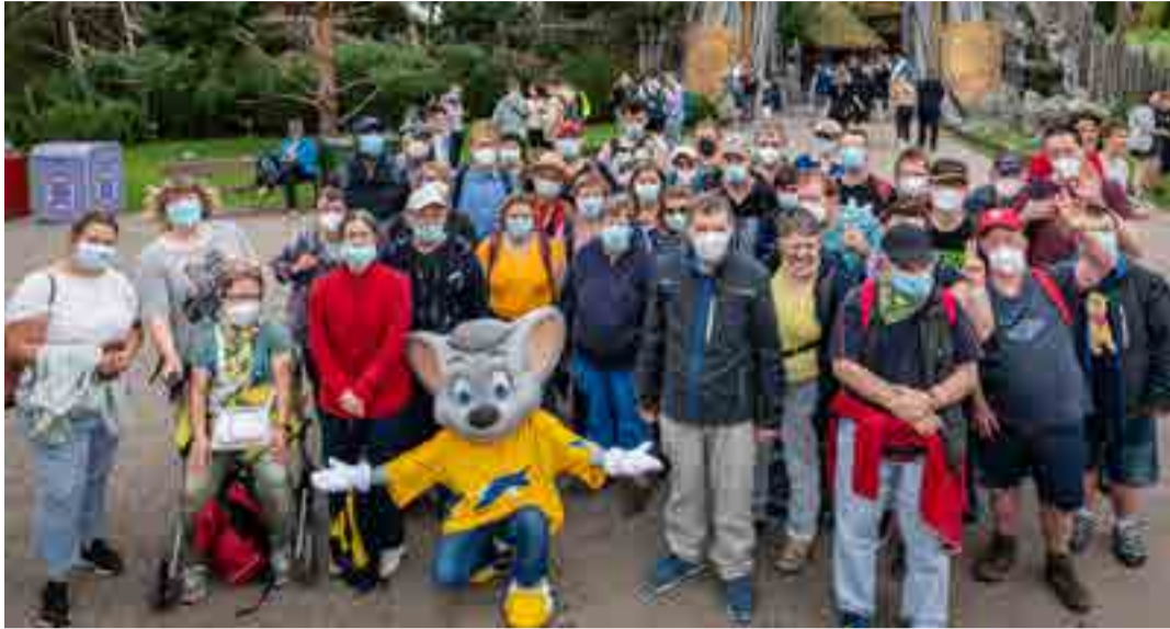
Die Oberschwäbische Behindertenwerkstätte – OWB aus Bad Saulgau

Aktion „Frohe Herzen“ findet ausnahmsweise bis Dezember statt