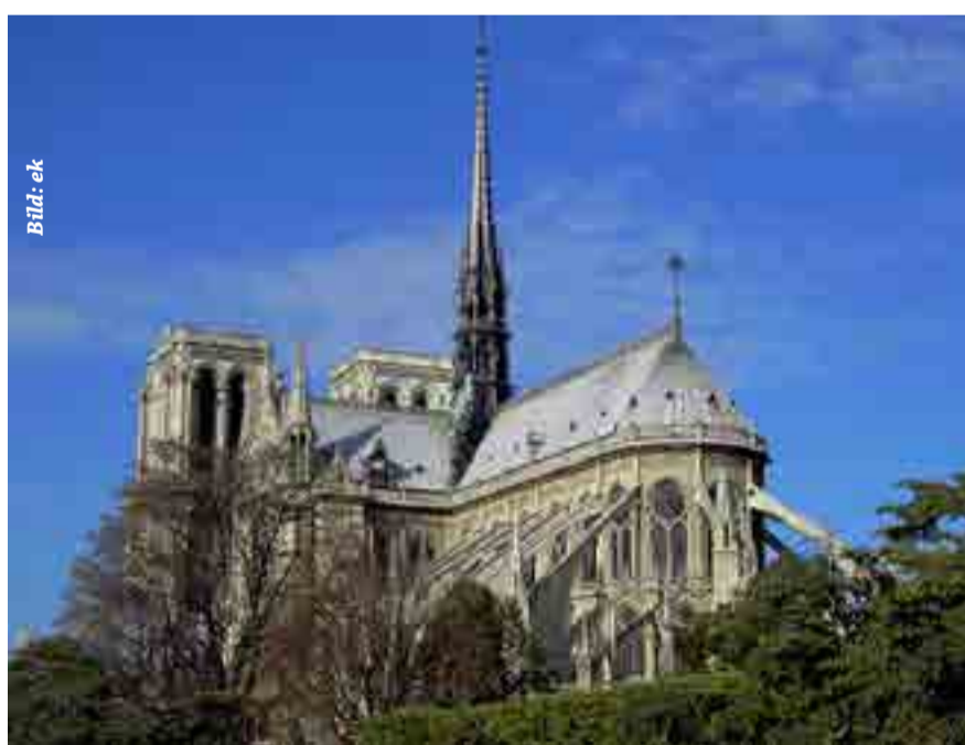
Notre Dame ist für viele Franzosen der wichtigste Bau der Welt

stellten die Forscher fest, dass sie noch nicht vollständig getrocknet waren. Doch viel schwerer wiegt, dass vom Dach der Kathedrale aus große Mengen giftigen Bleis in die Atmosphäre durch Schmelzen freigesetzt wurde. Noch heute ist Blei in Dächern der ganzen Welt vorhanden. Es kann jedoch auch toxisch sein und wird man ihm ausgesetzt, kann es auch zu einer Reihe von physischen und neurologischen Problemen führen. Wie stand es um die Kontaminierung der