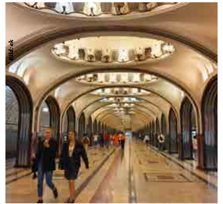
Wohnzimmeratmosphäre Metro, hier Mayakowskaya

na-Vorschriften in Deutschland und Russland, das als Hochrisikogebiet eingestuft ist, erforderten zudem präzise Vor-