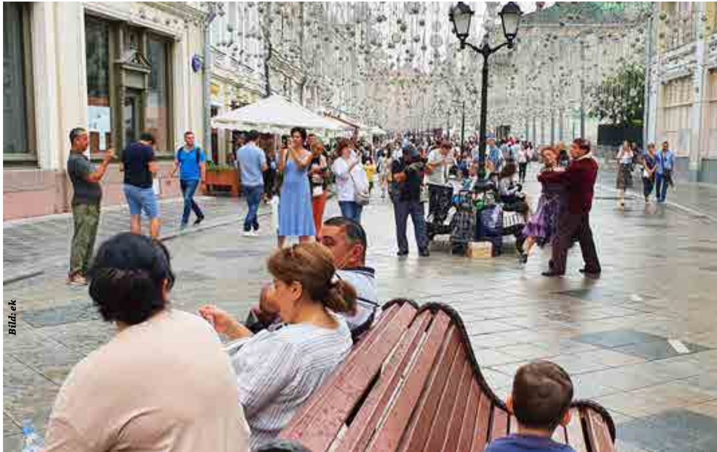
Auf ein Tänzchen in der Nikolskaya Straße

Moskau ist in einer historischen Angelegenheit mit Breisach vergleichbar. Gerade auch deswegen ging es auf Spurensuche in die Sehnsuchtsstadt Moskau. In der Stadt der 1000 Türme wird Tradition gelebt, die Architektur verspricht historische Einblicke und es werden baulich durchaus neue Wege gegangen. Emsige Bautätigkeit und viele Baukrans zeugen davon. Die Chorgemeinschaft Breisach hat das Lied „Moskau bei Nacht“ im Repertoire und dabei werden 1000 Türme genannt und besungen. Doch hat die Stadt tatsächlich so viele Türme? Das wurde in der Chorgemeinschaft durchaus schon thematisiert. Das machte doch neugierig auf diese erhabene Bausubstanz. Etliche dieser Türme sind auf den Zwiebelturmkuppeln mit reinem Gold belegt. Falken sind im Kreml gezielte Wächter dieser Kostbarkeiten, letztendlich sollen sie die Vögel vertreiben, die das Gold auf den Kuppeln der Türme durch picken beschädigen könnten. Das Nachzählen der Türme wurde indessen bald aufgegeben, denn die vielen ortho-