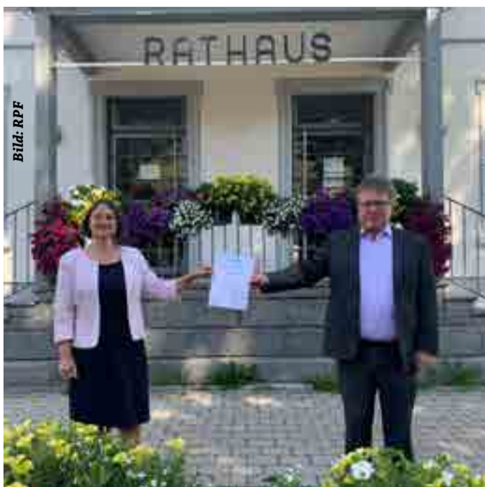
Regierungspräsidentin Bärbel Schäfer und Bürgermeister Andreas Wießner

„Dieses Siegel ist eine wichtige Auszeichnung für den Tourismus in Todtnau“, sagte Regierungspräsidentin Schäfer bei der Übergabe des Prädikats. „Es ist aber auch gleichzeitig ein Ansporn, den Entwicklungsprozess des Tourismusstandortes für Erholungssuchende nachhaltig fortzuführen.“ Grundlage für die Anerkennung der gesamten Stadt als Luftkurort war neben anderen Qualitätskriterien ein positives Klima- und Luftqualitätsgutachten des Deutschen Wetterdienstes, in dem bestätigt wird, dass Todtnau mit all seinen Ortsteilen die klimatischen und lufthygienischen Anforderungen an das Prädikat „Luftkurort“ erfüllt. Zwar waren der Kernort von Todtnau und einzelne Ortsteile bereits zuvor als Kur- und Erholungsorte ausgezeichnet, ein einheitliches Prädikat für die ganze Kommune fehlte aber bislang. Neben dem Kernort, Muggenbrunn und Todtnauegg schließt die staatliche Anerkennung jetzt auch die Ortsteile Aftersteg, Brandenburg-Fahl, Gschwend, Präg und Schlechtan mit ein. Todtnau ist einer von insgesamt rund 137 Erholungs- und Kurorten im Regierungsbezirk Freiburg. Durch die Auszeichnung als Luftkurort hat die Stadt unter anderem die Möglichkeit, bei Investitionen in die öffentliche Tourismusinfrastruktur eine höhere Förderung aus dem Tourismusinfrastrukturprogramm des Landes Baden-Württemberg zu erhalten. Darüber hinaus können nur prädikatisierte Kommunen für Vorhaben in Hallen- und Freibädern eine Förderung erhalten.