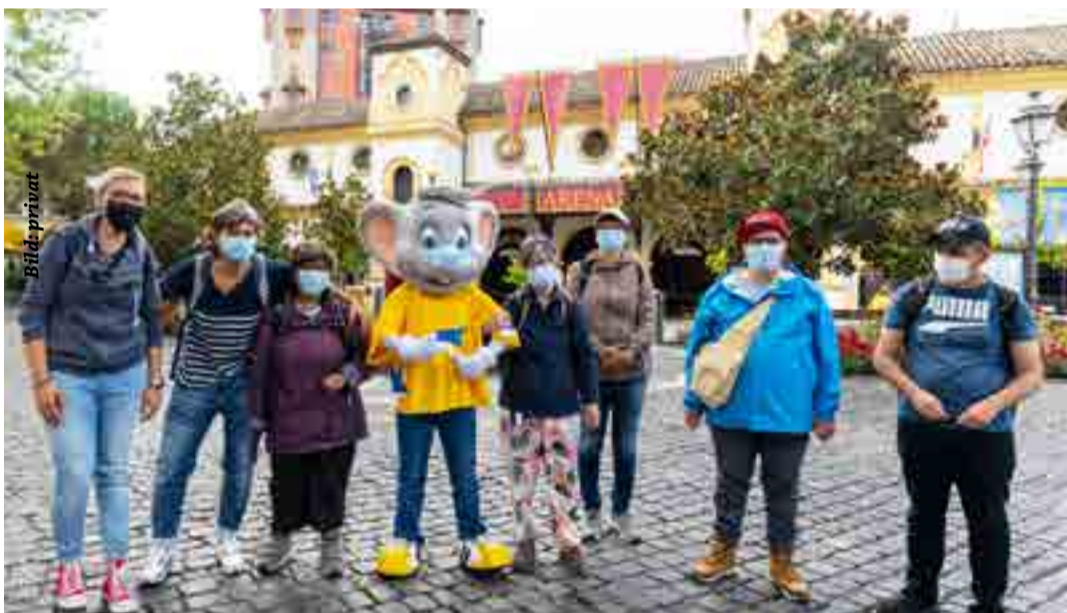
„Les Ateliers Protégés Jurassiens“ aus Delsberg in der Schweiz

Unvergessliche und unbeschwertere Momente in einer traumhaften Welt erleben – Im Rahmen der beliebten Aktion „Frohe Herzen“ lädt der Europa-Park seit dem 23. August wieder soziale Einrichtungen ein, einen ereignisreichen Tag in Deutschlands größtem Freizeitpark zu verbringen. Da die Frühjahrsaktion aufgrund der Corona-Pandemie und des Lockdowns nicht stattfinden konnte, führt der Europa-Park „Frohe Herzen“ erstmals und ausnahmsweise bis Dezember durch. Somit können jeden Tag, außer am Wochenende, vier Gruppen mit jeweils maximal 50 Personen außergewöhnliche Stunden erleben. Europa-Park Inhaber Roland Mack : „Die Aktion ‚Frohe Herzen‘ existiert in unserem Unternehmen seit der ersten Stunde. Mehr als eine Million Menschen sind auf diese Weise mittlerweile bei uns gewesen. Gerade in der Corona-Pandemie wollen wir jede Möglichkeit nutzen, Menschen ein Lächeln ins Gesicht zu zaubern.“ So waren Ende August neben einer Gruppe aus Frankreich und der Schweiz auch die Oberschwäbische Behindertenwerkstätte – OWB aus Bad Saulgau in Deutschlands größten Freizeitpark. Menschen mit Behinderungen finden in der Einrichtung spezielle Ansprechpartner, die sie unter anderem bei der Job- und Wohnungssuche unterstützen.