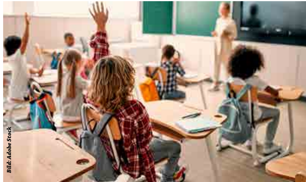
Die Kinder können sich hoffentlich auf ein gutes Schuljahr 2021/2022 freuen

Afghanistan ist ein Problem, das uns alle erwischt hat, die wir lieber ignorieren wollten, dass die Taliban das ferne Land längst viel mehr im Griff hatten, als das nach außen kommuniziert wurde - wegen der falschen Lageeinschätzung, oder einfach weil wir es nicht wahrhaben wollten. Freilich hat dieser etwas merkwürdige Sommer ja tatsächlich nicht dazu beigetragen, die Lage insgesamt zu entspan-