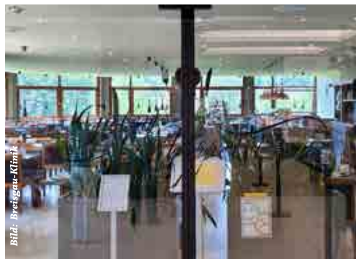
Restaurant mit Gütesiegel