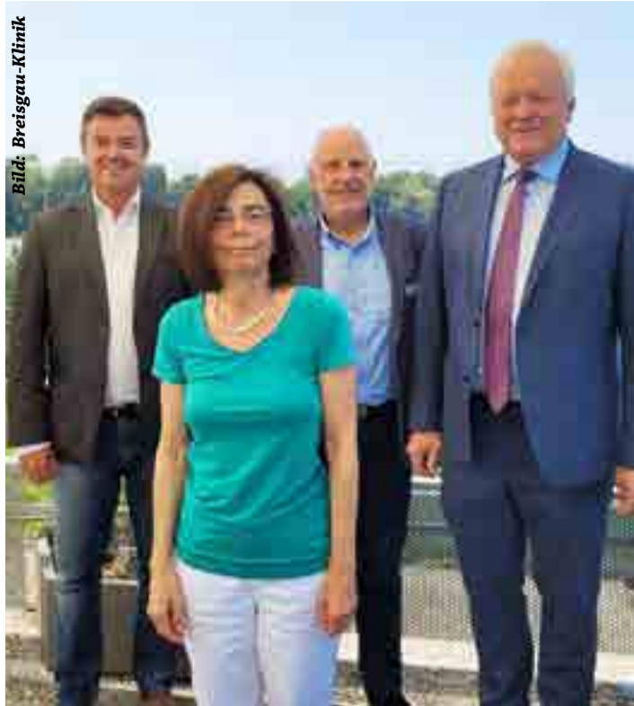
Offizielle Besichtigung durch den Bürgermeister

Für die Patientenorientierung und Behandlungsqualität in den angebotenen Kompetenzfeldern Orthopädie/Unfallchirurgie, Rheumatologie, Onkologie und Gastroenterologie wurde das über 180 Betten verfügende Reha-Kompetenzzentrum bereits zum sechsten Mal in Folge vom Magazin Focus Gesundheit als Top-Reha-Klinik eingestuft. Bestätigt wird die Zugehörigkeit zur