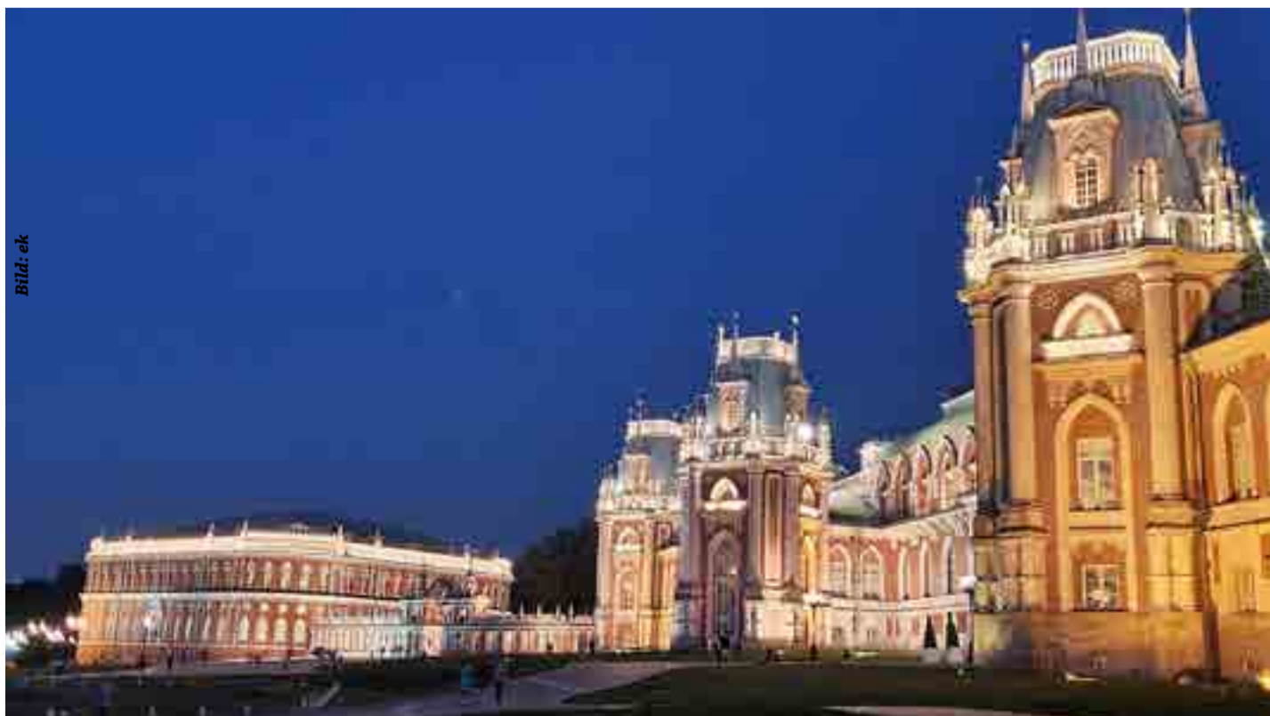
Auf ein Tänzchen in der Nikolskaya Straße

Stadt mit neuem Gesicht. Baumeister des Zaren bauten einen neuen Kreml, diesmal aus Stein. Der Kreml wurde zu einer der sichersten Festungen in Europa. Dazu wurde Moskau europäisiert und italienische Architekten verschönerten die Stadt. Das ist auch heute noch deutlich erkennbar. Nach dem Umbau wurden der Rote Platz und Kitaj-Gorod zu Marktvierteln und in den Folgejahren wuchs die Stadt in weiten Dimensionen über den heutigen Gartenring hinaus. 1812 war Moskau nach der Besetzung durch Napoleon nochmals zerstört worden. Etwa 6000 badi- sche Soldaten waren daran beteiligt, als ein Brand Moskau verwüstete. Damit haben Moskau und Breisach eines gemein- sam. Beide Städte wurden in ihrer Historie jeweils komplett durch Brände zerstört. Erin- nert sei dabei an die Brandzer- störung im Jahr 1793 von Brei- sach durch die Franzosen, als danach kein Haus mehr stand.