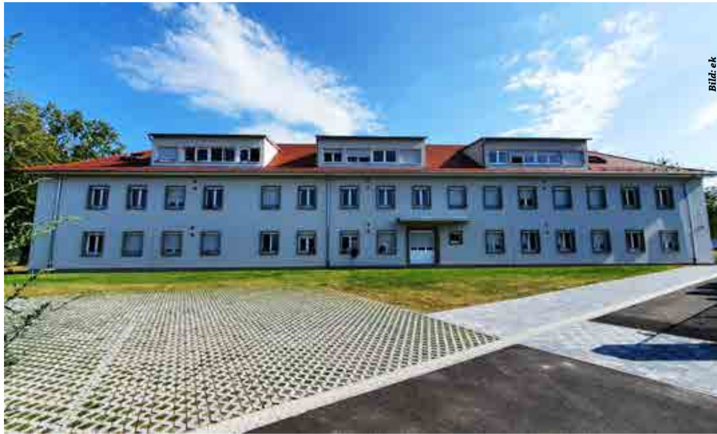
In Breisach gibt es in der Burkheimer Landstraße eine Erstaufnahmeeinrichtung für Flüchtlinge

Afghanistankrise ist zum Topthema dieser Tage geworden