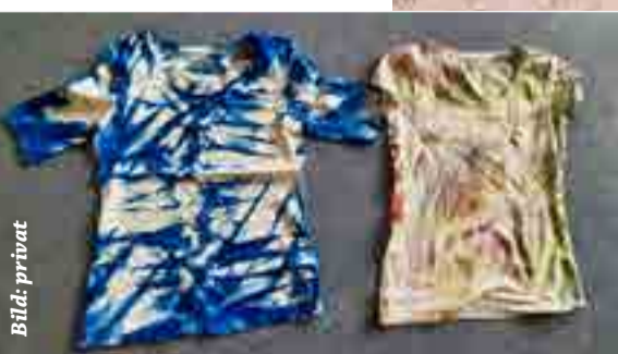
Textilien selbst bedrucken - das machte vielen Spaß beim Breisacher Sommercamp 2021

wahrnehmen. Es wurde zusammen gebastelt, Gläser wurden bemalt, T-Shirts bedruckt und auch ein Barfußpfad im Schulgarten wurde gebaut, um nur einige wenige Angebote zu nennen.